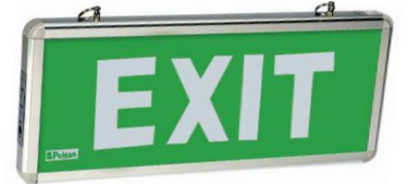
203891 Tek Yön/One Side