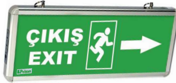
203887 Sağ Ok/Right Arrow