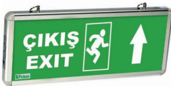
203889 Yukarı Ok/Up Arrow