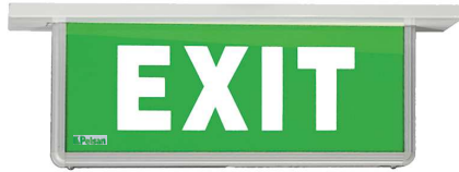
Sıva Altı Recessed Mounted