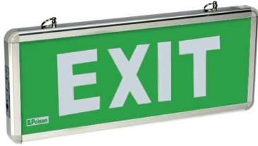
Sıva Üstü Surface Mounted